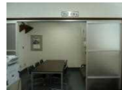
【コミュニティルーム】